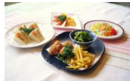
※上記写真はイメージです。

(例) +1,000円(税込 1,080円)コース 軽会食 軽会食のお手軽プラン! フリードリンクB(ソフトドリンク) お一人様 700円(税込 756円) コーラ・ウーロン茶・ジンジャエール・オレンジジュース・ホットコーヒー